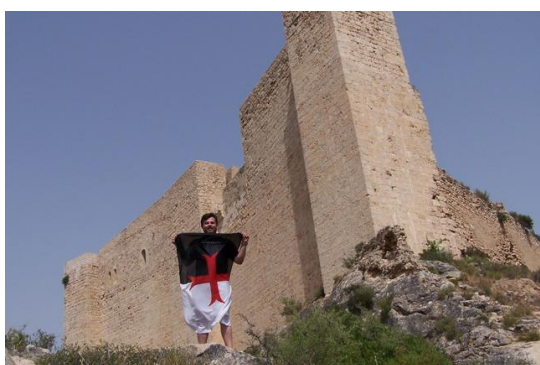
10. Vista trasera del castillo

Las partes mas antiguas del castillo datan de una construcción andalusí del siglo XI para proteger la zona de los ataques cristianos. Después de que Ramón Berenguer IV conquistase Tortosa y los terrenos adyacentes, cede la fortaleza a la Orden del Temple, que transforman la construcción sarracena en fortaleza templaria. Cuando deviene la orden de arresto a los templarios en 1307, los caballeros de Miravet se encierran en la fortaleza y se produce un asedio por parte de las tropas de Jaime II que durará hasta la capitulación de los del Temple en 1308. Tras este celebre suceso el castillo pasa a manos, como no, del Hospital. También fue fortín en las guerras carlistas a lo largo del siglo XIX y es utilizado también de polvorín y fortaleza por las tropas de Franco durante la guerra civil del pasado siglo. Actualmente esta en proceso de restauración.