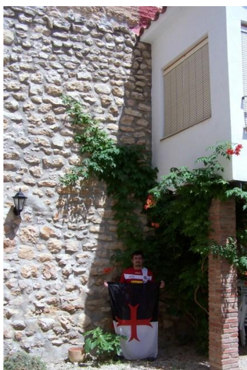
1. Patio de la casa familiar con la pared compartida

Pequeña población de menos de mil habitantes y bañada por las aguas del Ebro. En un documento de 1184 se habla de una pequeña comunidad sarracena que cultiva los huertos de propiedad cristiana junto al pequeño núcleo de población. Es al cabo de poco tiempo que una dotación de templarios dependientes del castillo de Miravet se establecen en el pueblo y construyen la casa convento, la iglesia de San Isidro y aprovechan 2 torres de guardia construidas por los sarracenos. Hoy día, la casa convento es una propiedad privada reconvertida en hogar, y la iglesia en sala de actos del ayuntamiento, pues alrededor de 1750 se construye una nueva iglesia dedicada a San Miguel Arcángel y San Benito y la templaria quedó en desuso. De las dos torres, una esta en ruinas y la otra esta abandonada. La iglesia de San Isidro es muy especial para mí, pues la casa que posee mi familia comparte la pared del comedor y del patio con la pared sur de la iglesia.