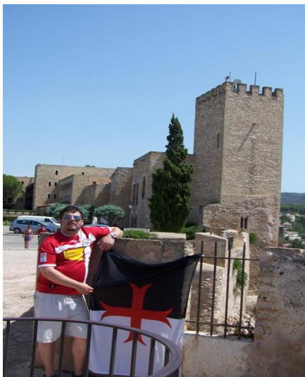
5. Castillo-Zuda de San Juan en Tortosa

La ciudad de Tortosa ofrece numerosos destinos turísticos entre los cuales se encuentran una de las más importantes juderías de España, la hermosa catedral gótica de Santa María, el monumento a los caídos en la Batalla del Ebro y el Castillo-Zuda de San Juan. Esta fortaleza construida para un reino taifa es prontamente conquistada por Ramón Berenguer IV en 1148. Será cedida a la Orden del Temple por Alfonso II. Luego de suspenderse la Orden en el siglo XIV tendrá diferentes propietarios hasta que es tomada en la guerra de Independencia del siglo XIX causando grandes desperfectos. Actualmente es un Parador Nacional que ofrece desde sus torres y jardines una hermosa vista de la ciudad.