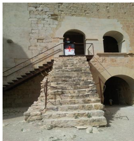
11. Entrada a la iglesia del castillo Dedicada a San Miguel Arcángel

Bien, hasta aquí esta pequeña ruta templaria que se puede hacer en un día. También tengo que deciros que hay una ruta llamada Domvs Templi patrocinada por los ayuntamientos de Monzón, Lleida, Miravet, Tortosa y Peñíscola, donde se hace una excursión que dura 2 días y se visitan los castillos de estas poblaciones. Espero que os hayan entrado ganas de visitar estos monumentos y revivir nuestras raíces porque nuestra amada Orden tiene un pasado un presente y un glorioso futuro.