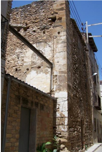
3. Torre de vigilancia que también servía para comunicarse con los castillos de Miravet i Tortosa a través de una red de torres construidas al lado del río.