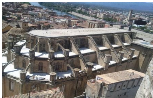
6. Vista de la catedral gótica y el Ebro al fondo