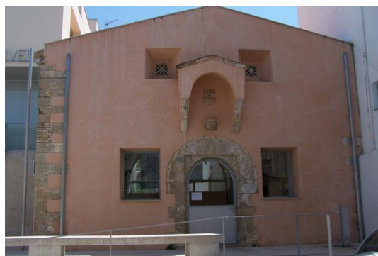
2. Antigua iglesia de San Isidro ahora reconvertida en sala de actos del Ayuntamiento tras una horrible restauración.